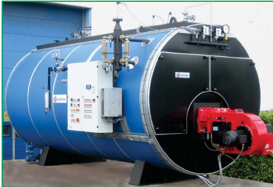
5 t/h OPTI-kjel klar til forsendelse

Biovarmeanlegg Rustfritt Dampkjeler Prosessrør Dampanlegg Gass VVS Fjernvarmesentraler Næringsmiddel Industrirør Varmtvannskjeler